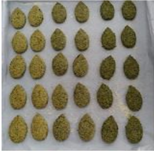
A B C

Cookies bayam sorgum yang dihasilkan memiliki tekstur yang renyah, rasa yang manis gurih dengan warna hijau kecoklatan. Berbagai jenis cookies bayam sorgum hasil penelitian dapat dilihat pada gambar 3.